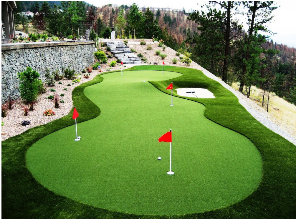
Referencia de combinación de cesped artificial en dos alturas