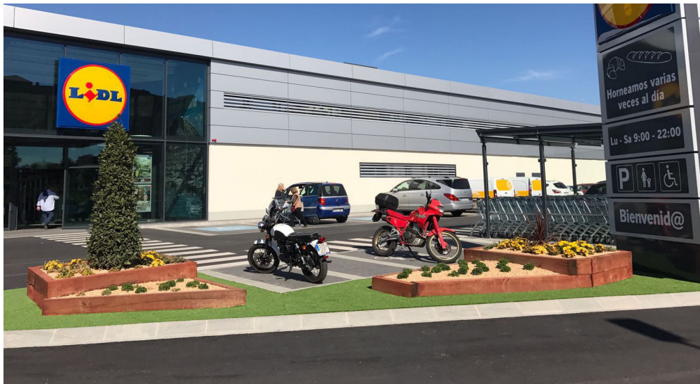
Jardinera de traviesas de dos alturas con cesped artificial