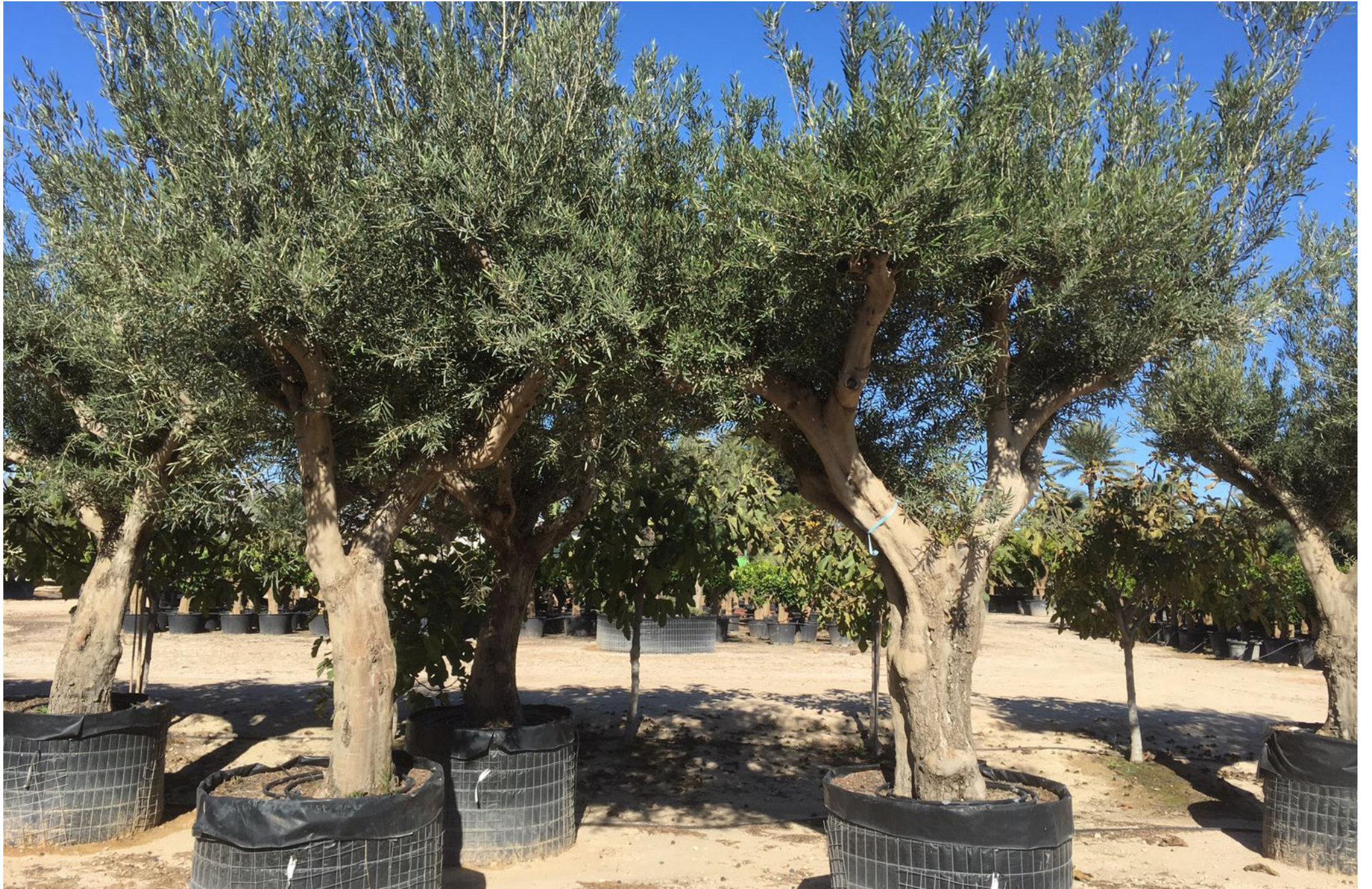
Olivo de copa