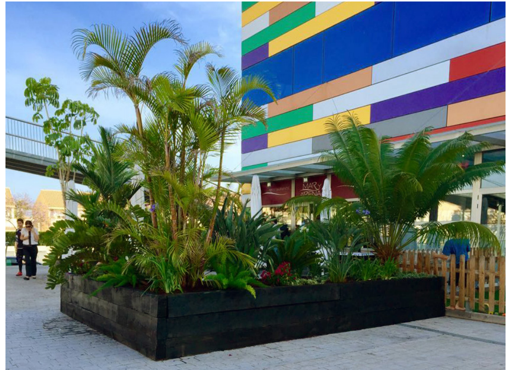
Jardinera de traviesas de tres alturas