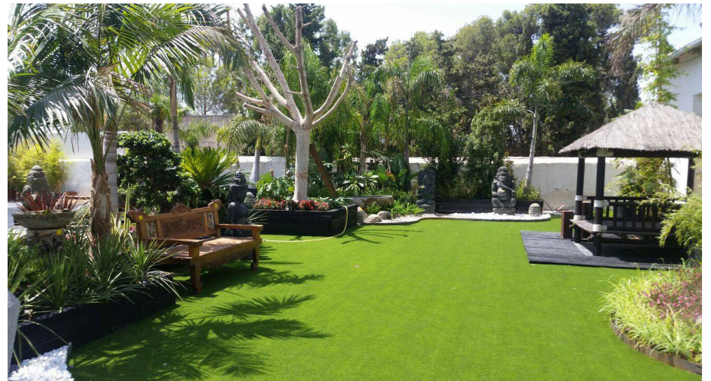
Jardineras de traviesas con diferentes alturas y cesped artificial