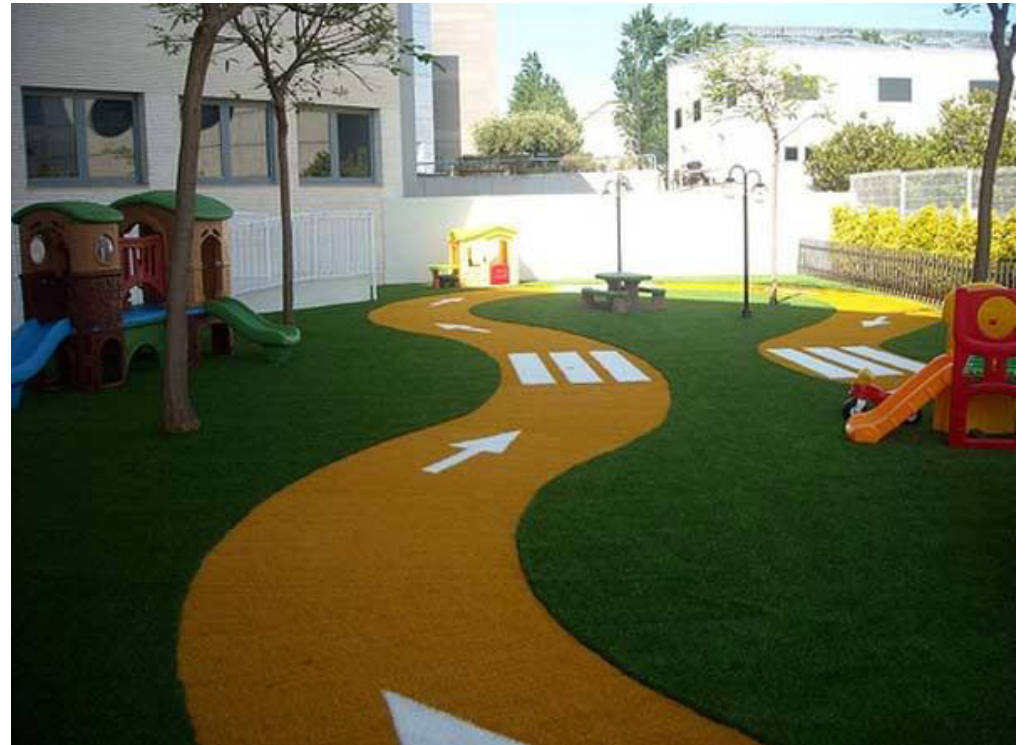
Referencia de circuito infantil con cesped artificial en dos colores