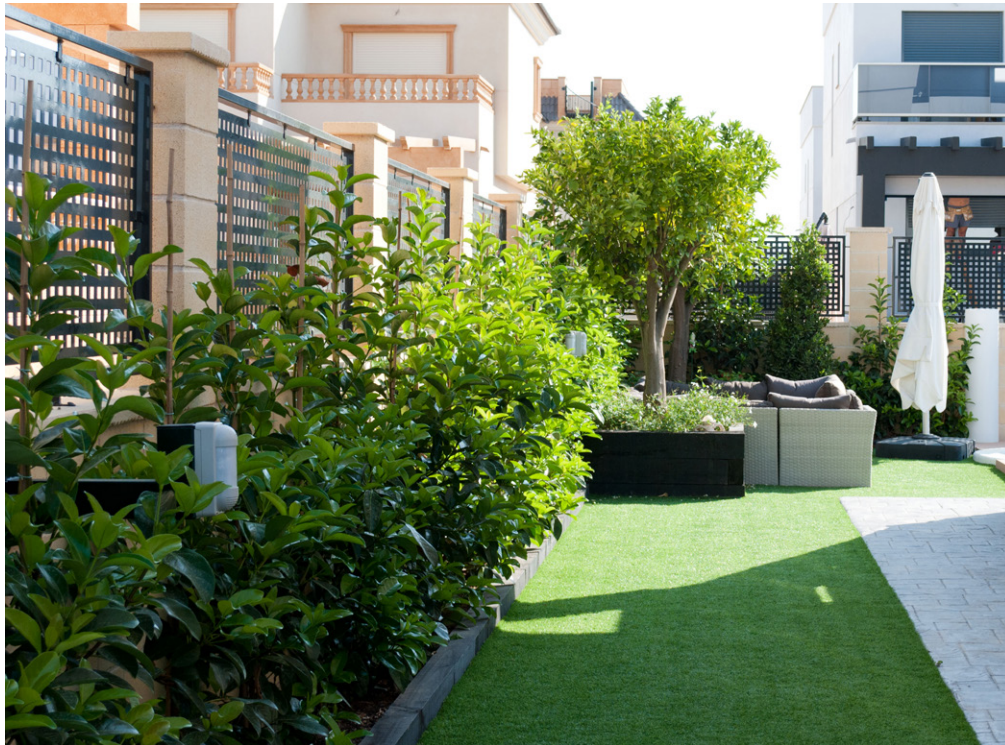
Jardinera de traviesas con seto de Viburnum lucidum y cesped artificial