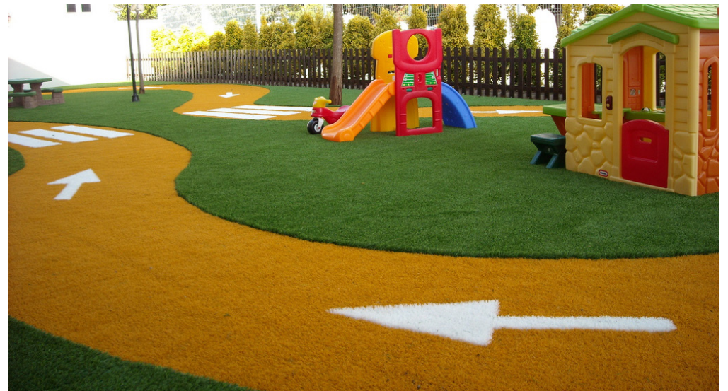
Referencia de circuito infantil con cesped artificial en dos colores