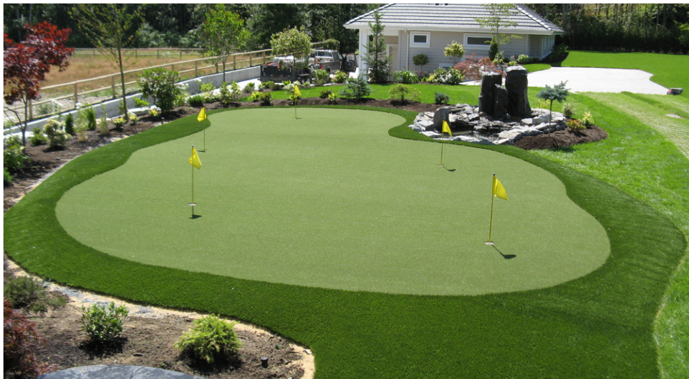
Referencia de combinación de cesped artificial en dos alturas